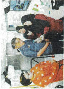
MOHAMAD ketika melawat pameran sempena Simposium Pengembangan Subsektor 'Taman di Klang Semabun'.

KLANG - Kementerian Pertanian dan Keterjaminan Makanan (KPKM) melalui sempadan dipertingkatkan. Untuk memastikan keselamatan dan kesejahteraan kambing dan kambing, terutamanya menjelang sambutan Hari Raya Aidiladha, tahun ini.