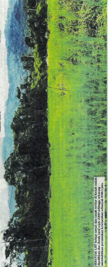
SEBANYAK 1,877 hektar sawah dan tanah terbiar di Kedah sudah dipulihkan dan diusahakan sejak 2009 sehingga sekarang. Memandangkan kesediaan tanah terbiar sebanyak 1,083 hektar, KEDA juga berhasrat membangunkan kawasan terbiar di luar Lembah Klang.