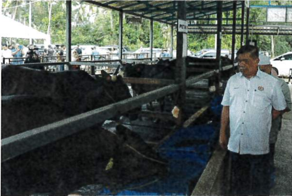
Mohamad ketika hadir melawat Projek Pembiakan dan Penternakan Lembu Baka Wagyu semalam.

BACHOK: Kementerian Pertanian dan Keterjaminan Makanan (KPKM) bersedia menjalankan audit terhadap pemegang lesen borong beras, eksport, import, kilang padi, membeli padi, beras runcit dan kelulusan khas menjual benih padi bagi benih padi sah (BPS) bagi membanteras isu