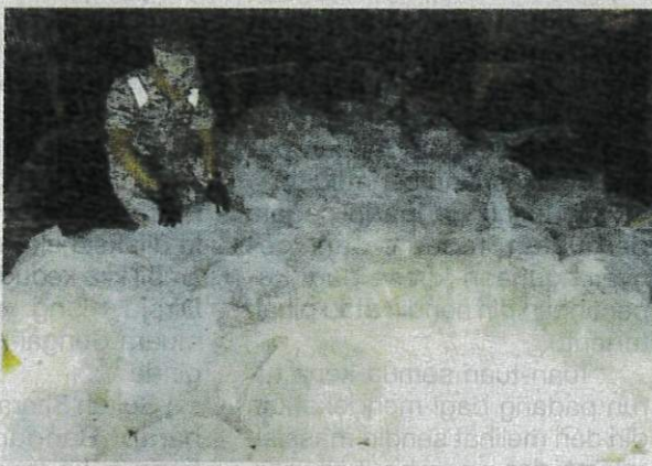
Anggota Maritim Malaysia memeriksa kira-kira 312 bungkusan plastik mengandungi benih udang hidup cuba diseludup masuk dari Thailand.

Tambah beliau, kes akan disiasat di bawah seksyen 40 (1)(a) Akta Perikanan 1985 kerana mengimport ke dalam atau mengeksport ke luar Malaysia, ikan hidup tanpa permit atau dengan melanggar apa-apa syarat dalam permit.