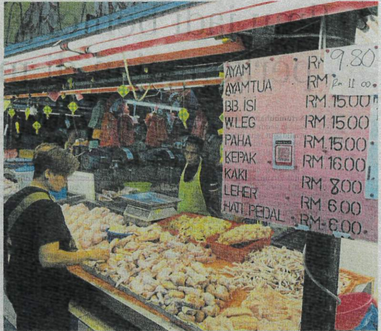
Harga ayam segar yang dijual di sekitar bandar raya Johor naik 30 sen kepada RM9.80 sekilogram, mulai semalam.

Seorang lagi peniaga ayam segar yang mahu dikenali sebagai Az-