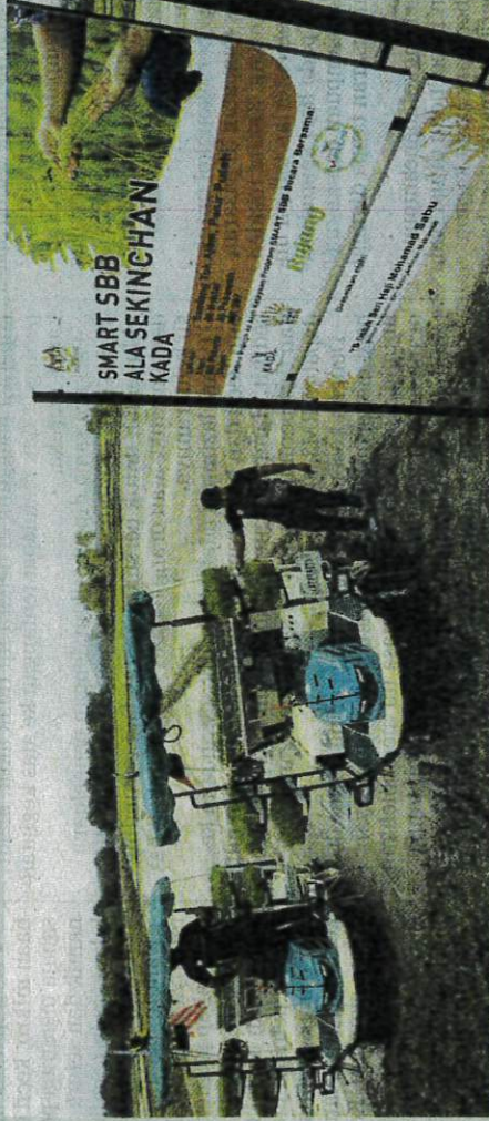
Program Smart Sawah Berskala Besar (SMART SBB) Ala Sekinchan di Bendang Tok Ajam, Pasir Puteh, Tangkak.

"Tanaman padi ala Sekinchan ini mestilah tanaman yang mengikut masa yang betul, baja yang sesuai dan pengairan yang sesuai.