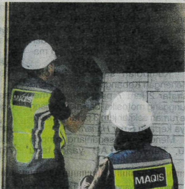
Produk sejuk beku menggunakan dokumen mengelirukan berjaya digagalkan Maqis.