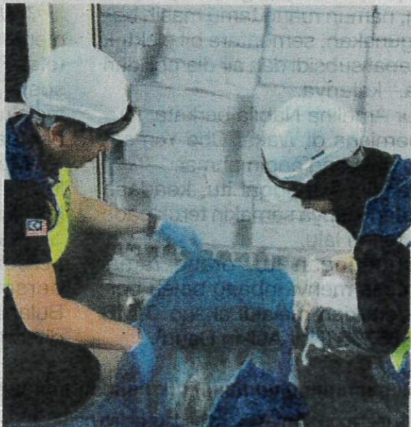
Maqis memeriksa perut babi sejuk beku dibawa masuk dari Sepanyol.

“Maqis sentiasa komited menjalankan penguatkuasaan undang-undang dan akan terus diperkasakan lagi di semua pintu masuk negara bagi memastikan kawalan penyakit ikan, haiwan, tumbuhan dan jaminan keselamatan makanan terpelihara,” ujarnya.