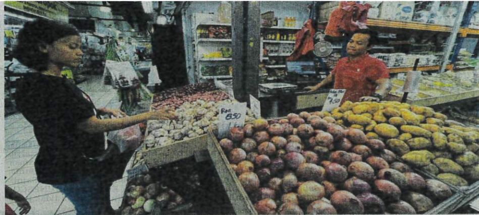
Bawang merah dari Belanda yang dijual RM8.50 sekilogram di sebuah pasar di Tampoi, Johor.