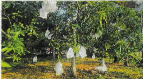
KEBANYAKAN pokok memulam harumanis sekitar Perlis mula berbunga dan dijangka mengeluarkan hasil bermula pertengahan April ini.

"Saya telah arahkan penguatkuasa Kementerian Perdagangan Dalam Negeri dan Lembaga Pemasaran Pertanian Persekutuan (FAMA) turun padang memantau harga buah memulam," katanya.