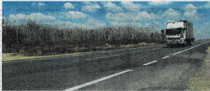
CUACA panas melampau khususnya di Chuping semalam yang merupakan antara titik panas di Perlis berisiko terdedah dengan kebakaran.

naan juga menjejaskan industri padi di negeri ini dengan hasil dijangka merosot sehingga 50 peratus daripada lima tan metrik perhektar kepada sekitar dua ke tiga tan metrik sahaja. Setakat ini,