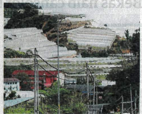
FENOMENA El Nino dikhuatiri menjejaskan kualiti sayur dan bunga yang ditanam di Cameron Highlands.

"Walaupun kelembapan baik untuk tanaman tetapi kelembapan yang terlalu tinggi akan mendedahkan tanaman kepada penyakit dan serangan serangga, bermakna tumbesa-