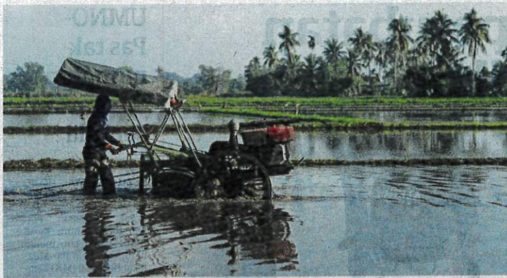
PESAWAH kini menghadapi kerugian disebabkan pelbagai faktor seperti perubahan cuaca drastik.