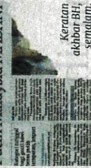
Keratan akhbar BH, semalam.

Kerajaan perkenal Beras Putih Malaysia MADANI