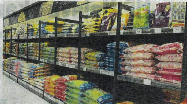
Beras tempatan sudah tidak memasuki pasaran sejak tiga bulan lalu.

Ujarnya, dia kini menggunakan satu jenama beras putih import sahaja kerana sudah serasi biarpun harga meningkat