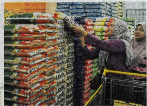
BERAS putih tempatan dan import tunggal dikenali sebagai beras putih Malaysia Madani diperkenalkan di pasaran bermula Isnin ini.

"Kami hanya terima maklumat menerusi laporan berita sahaja, kenapa tidak berbincang dahulu dengan kami daripada buat tindakan tergesa-gesa ini?" soalnya.