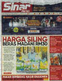
Laporan Sinar Harian pada Khamis.

Oleh TUAN BUQHAIRAH TUAN MUHAMAD ADNAN PUTRAJAYA