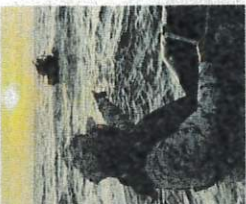
Maritim Selangor memulakan bot digunakan PATI untuk menangkap ikan menggunakan bubu naga di perairan Klang.

masing oleh dua warga Myanmar dan dua warga Indonesia. "Pemeriksaan lanjut mendapati semua suspek berusia lingkungan 22 hingga 30 tahun tidak mempunyai lesen perikanan diri sah. Mereka kemudiannya ditahan dan disiasat mengikut Seksyen 113(c) Akta Puncungan, 1985 dan Seksyen 6(1)(c) Akta Puncungan 1985. Dalam pada itu, Abdul Muhsin berkata, penggunaan bubu naga adalah menyalaahi undang-undang, malah menyelesaikan ekosistem laut dan sukan perikanan nelayan tradisional pesiar pantai. Menurutnya, Maritim Selangor sentiasa komited meneken operasi dan rondaan di sepanjang perairan negeri bagi membantertas Keselamatan dan pelindungan undang-