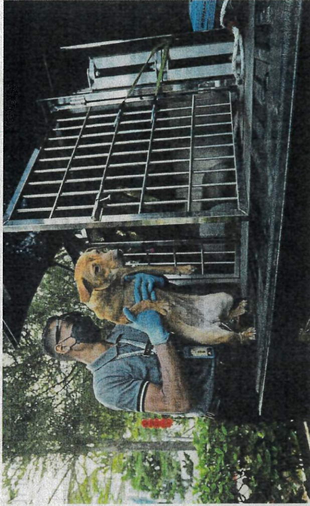
In safe hands: The dog was injured in the incident but has now recovered and is under the state Veterinarian Department's care.