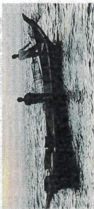
Dua PATI ditahan Maritim Selangor selepas dikesan menangkap ikan menggunakan bubu naga.