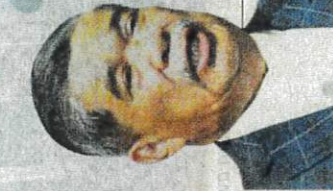
Mohamad Sabu, Menteri Pertanian dan Keterjaminan Makanan

Mengenai soalan Hassan ke mana perginya beras tempatan sehingga orang ramai berdepan kekurangan mendapatkan bekalan, Mohamad berkata, kenaikan harga beras import akibat tekakan daripada ketidakstabilan harga beras global, dasar negara pe-