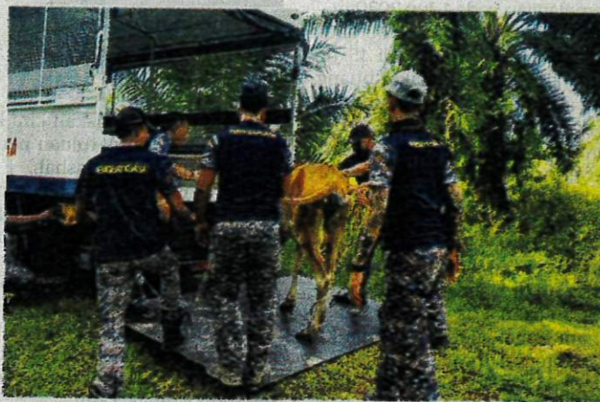
ANGGOTA penguat kuasa MDGM menangkap seekor lembu yang berkeliaran di lokasi kerap berlakunya kemalangan di Gua Musang kelmarin.