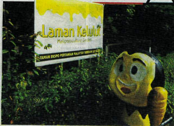
LAMAN Kelulut di MAEPS, Serdang, Selangor menempatkan antara tujuh hingga lapan spesies kelulut.