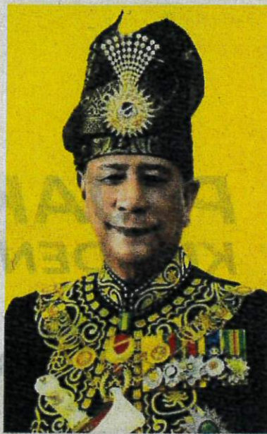
Tuanku Sultan Kedah

petani kemampuan kewangan untuk mengguna teknologi terkini selain ilmu