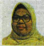
Penganalisis Penyelidikan, Institut Masa Depan Malaysia (MASA)

• Rakyat perlu lebih cakna, berdisiplin menguruskan perbelanjaan harian, membuat perancangan kewangan jangka pendek dan panjang, serta mengambil keputusan kewangan bijak untuk mencapai kesejahteraan kewangan.