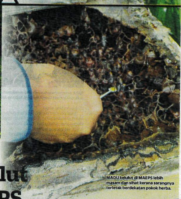
MADU kelulut di MAEPS lebih masam dan sihat kerana sarangnya terletak berdekatan pokok herba.