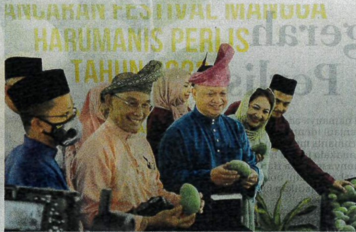
Pelancaran Festival Mangga Harumanis Perlis pada 2023.

Malah, Jabatan Pertanian membuka ladang Harumanis sendiri di Kompleks Pertanian Bukit Temiang dan Pusat Pertanian Bukit Bintang sebagai ladang