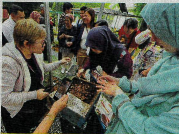
PARA pengunjung boleh merasa sendiri madu kelulut dari dalam sarang.

"Ya bagi memastikan pakej yang ditawarkan sesuai dengan kehendak mereka," jelasnya.