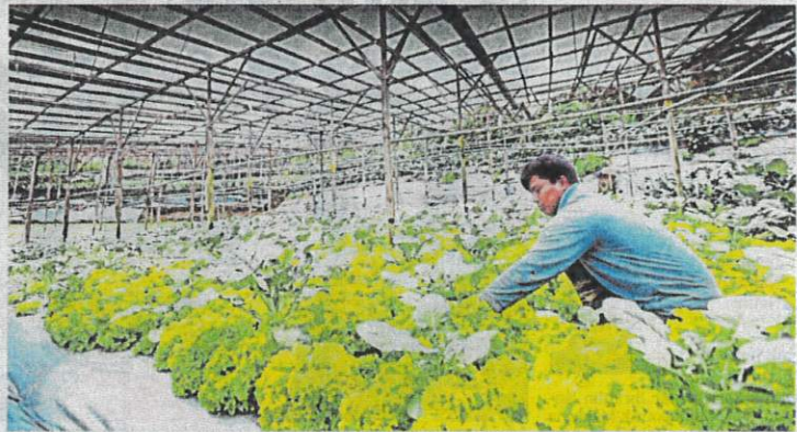
Industri penanaman sayur-sayuran di Cameron Highland akan terjejas jika isu pekerja asing masih tak selesai. (Foto hiasan.)

Senario itu akan menyebabkan harga sayuran di pasaran akan meningkat mendadak disebabkan bekalan berkurangan dengan hasil sayuran tidak dapat dikeluarkan seperti biasa, susulan kekurangan tenaga kerja kritikal.