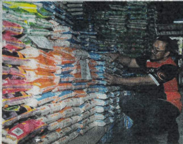
BERAS import memenuhi rak di pasar-pasar raya manakala beras tempatan boleh dikatakan jarang ditemukan sejak setahun lalu.

"Jadi, mereka juga tidak kisah untuk membeli padi dengan harga lebih tinggi me-