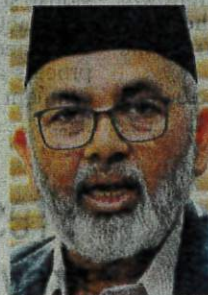
Datuk Syed Abu Hussin Hafiz Syed Abdul Fasal

"My proposal is that if we want to create a win-win situation for farmers without burdening consumers, perhaps the government could increase the amount of subsidy by another RM200 (per metric tonne)," he said.