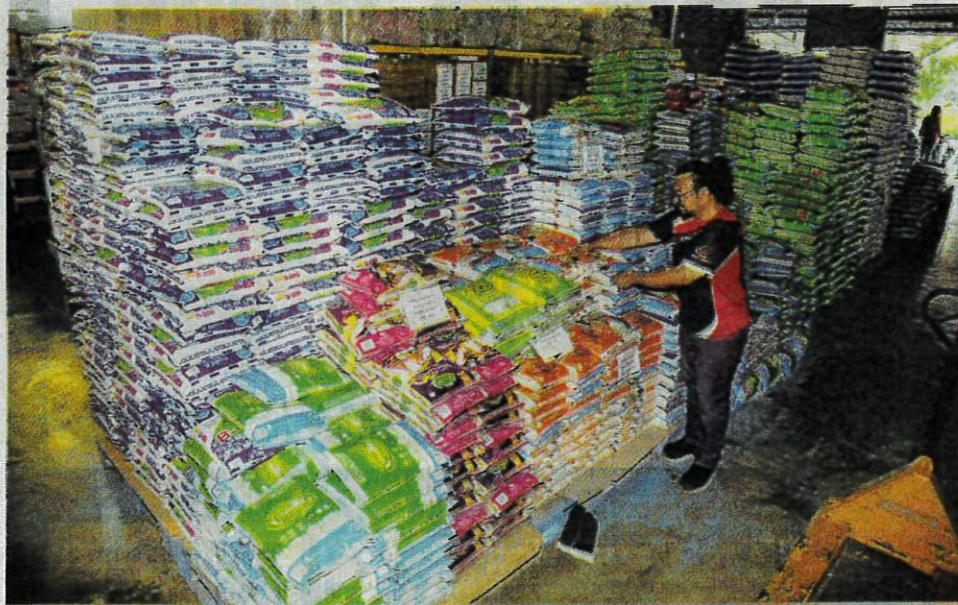
BERAS import memenuhi pasaran selepas kekurangan bekalan beras tempatan ketika ini. – GAMBAR HIASAN

Kerajaan bersetuju semua kontrak kerajaan mengguna pakai sepenuhnya BPI, sekali gus membolehkan bekalan tambahan BPT sebanyak 20,000 tan metrik dapat diedarkan sepenuhnya di pasaran pada April ini.