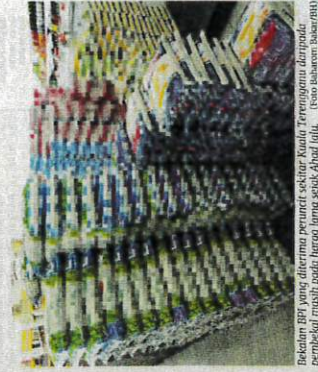
Bekalan BPI yang diarahkan pemerintah sejajar Kuala Terengganu daripada pembekal masih pada harga lama stok Ahad lalu.

beras tidak sama seperti di unjukan kerajaan. Bagaiman mahu turunkan harga jika be kulan diperoleh adalah tinggi ai tu. Kalau pada harga lama, ka semestara itu, seorang pegawai pemasaran syarikat pembekal BPI yang enggan didedahkan, berkata bekalan beras yang di umumkan penentuan harga baru Keldarin, tetapi tidak mengemulikan secara jelas kaedah diwarakan kepada syarikat pem- "Sama peruncit merancang dan bertanya bila harga BPI akan diturunkan, sehingga ada yang memonitorkan pesanan, namun ia akan diturunkan. Namun menerima bekalan beras yang masih pada harga lama, mereka pasti menjual dengan harga yang tinggi bagi mengumpul keuntungan," katanya.