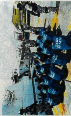
Nelayan asing Vietnam serta sekang ditubuhkan Maritim Malaysia yang menceroboh perairan negara mematu Op Jermat. Op Naga dan Op Tirs pada Sabtu lalu.

"Untuk tanggapan bagi pucukan ini, kita tidak mengahiri badan Perikanan bagi tempoh 2020 hingga 2023 sahaja, sebanyak tujuh kes (2020), lapan kes (2021) dan empat kes (2022).