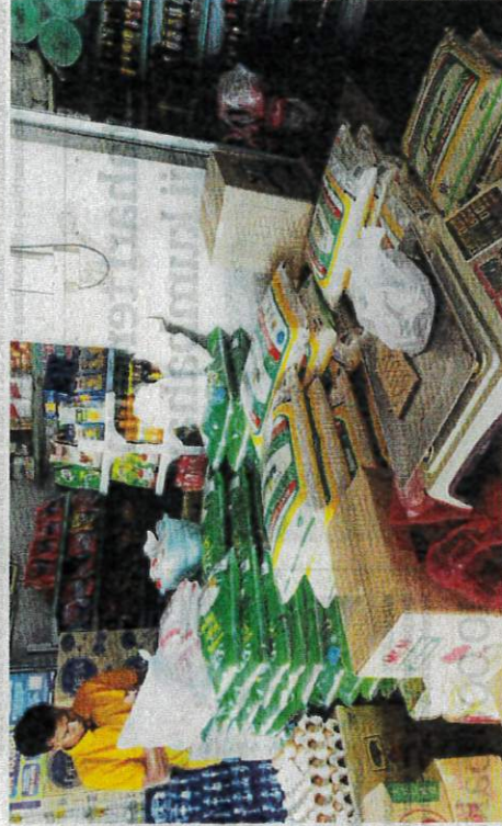
BERAS import yang masih dijual harga lama di sebuah kedai runcit di Kuala Terengganu semalam.