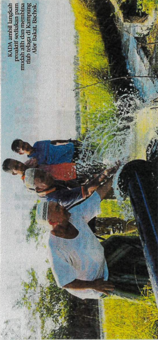
KADA ambil langkah proaktif sediakan pam mudah alih dan membina tiub telaga di Kampung Alor Bakat, Bachok.

Katanya, ketika ini fasa padi sudah memasuki tahap 'bunting anak' dan me-