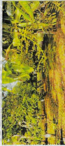
PENGUSAHA harumanis mengambil langkah dengan memastikan tanaman mereka mendapat sumber pengaliran mencukupi bagi meraih hasil pada musim ini di Perlis.

KANGAR – Keadaan cuaca yang terlalu panas di Perlis ketika ini dikhuatiri mempengaruhi pengeluaran harumanis, musim tahun ini.