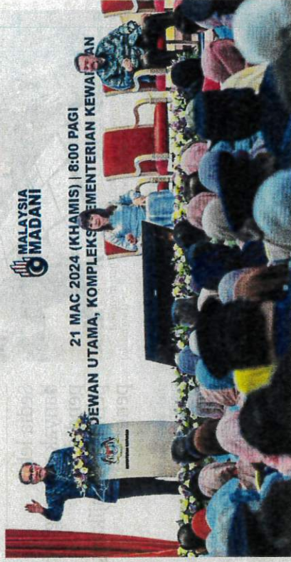
Anwar ketika berucap pada Perhimpunan Bersama Warga Kementerian Kewangan di Putrajaya, semalam.

Anwar merujuk Lembaga Pemasaran Pertanian Pesekituan (FAMA) dan Lembaga Perubuhan Peladang (LPP) yang ber-