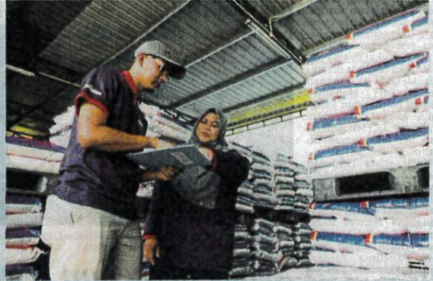
TEAM Baja Nadi bersedia dalam memastikan kapasiti pengeluaran yang optimum.