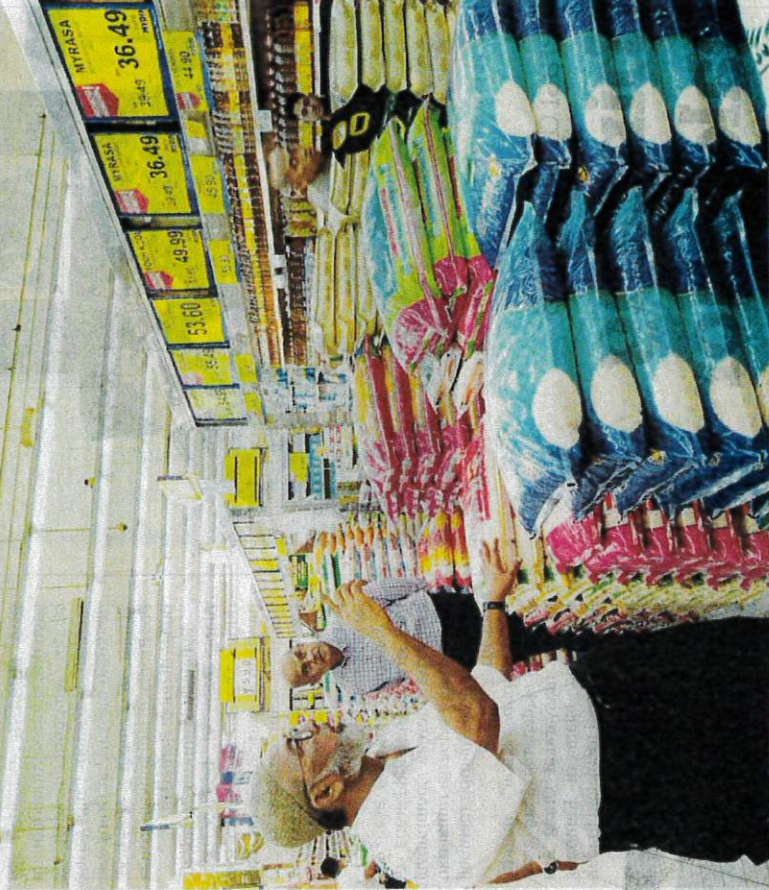
SYED ABU HUSSIN meninjau bekalan beras di sebuah pasar raya besar di Kuala Terengganu semalam.

Syed Abu Hussin Hafiz berkata, bahagian penguatkuasaan Task Force NACCOL akan turun padang menjelang akhir Ramadan ini untuk memantau harga dan keberadaan bekalan