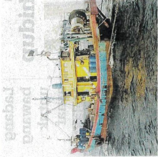
BOT tunda yang ditahan di Sungai Rungkup, Lumut pada Sabtu lalu.