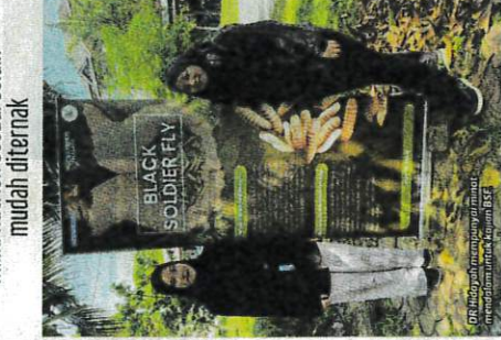
BSF juga merupakan alternatif kepada ternakan ikan. (Fasa) (Fasa) (Fasa)

"Malah, sisa buangan BSF juga boleh dijadikan sumber nutrisi untuk ternakan ikan. Dengan menggunakan BSF untuk ternakan ikan juga membuatkan penyelidik lebih mudah mengawal maklumat mengenai masalah ini," katanya.