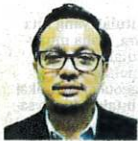
Ketua Laboratori Kajian Dasar Pertanian dan Makanan, Institut Pertanian Tropika dan Sekuriti Makanan, Universiti Putra Malaysia (UPM)