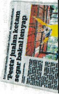
KERATAN Kosmo 9 Mac 2024.

"Jika ditangkap mereka boleh ditahan dan dikompaun sehingga maksimum RM20,000 atau didakwa di mahkamah dan jika sabit kesalahan boleh dilucut hak dan dibatalkan lesen," tambah beliau.