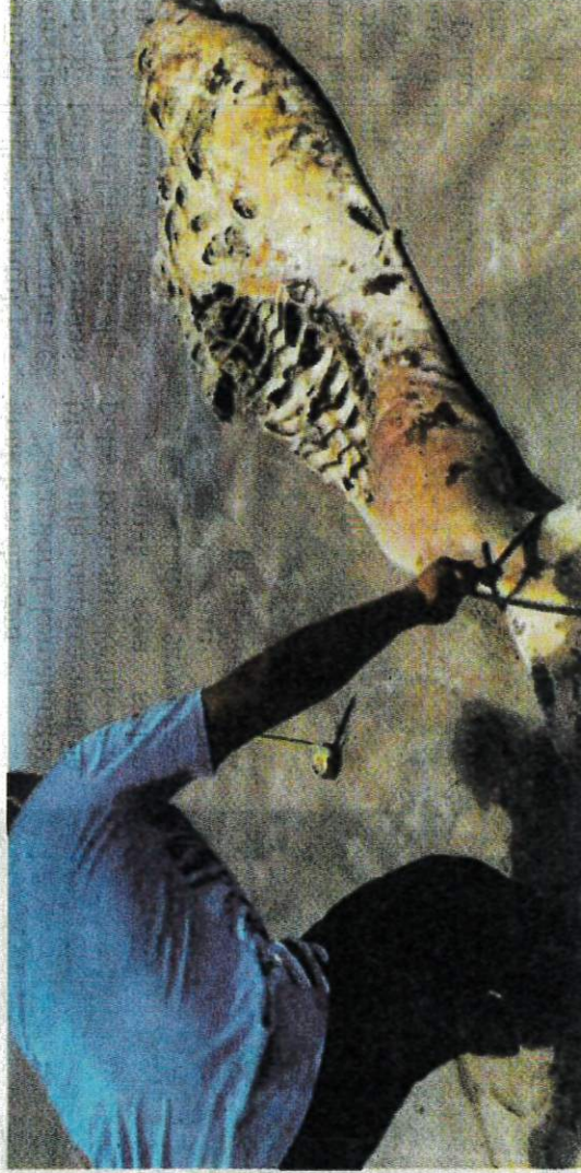
BANGKAI dugong dewasa sepanjang hampir satu meter ditemukan terdampar di kawasan pantai berhampiran Tanjung Leman.

Menurutnya, populasi dugong semakin berkur-