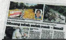
KERATAN Kosmo! kelmarin.

"Mana-mana perkara seumpama itu (menyimpan stok beras) sememangnya tidak boleh. Kalau tidak ada apa-apa, elok lah kita berikan kepada mereka yang memerlukan," katanya ke-