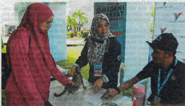
Sumbangan veterinarwan merangkumi usaha mengawal penyakit berjangkit zoonotik merentasi sempadan.

Pada masa sama, pengunjung juga boleh mendapatkan khidmat prosedur pemandulan haiwan peliharaan mereka