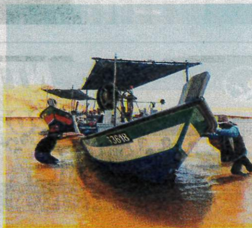
NELAYAN terpaksa menolak bot mereka yang tersangkut di beting pasir akibat muara cetek Sungai Merchang, Marang, Terengganu.

"Ramai nelayan yang mengalami kerosakan bot kerana tersangkut di beting pasir ketika cuba masuk ke muara dan ini menambahkan lagi kerugian mereka," ujarnya.