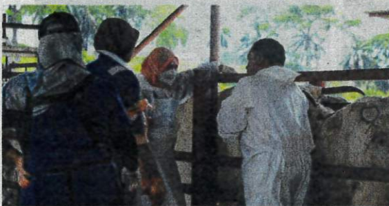
Bidang veterinar menjadi elemen penting dalam memastikan jaminan makanan berasaskan ternakan selamat untuk keperluan masyarakat global.