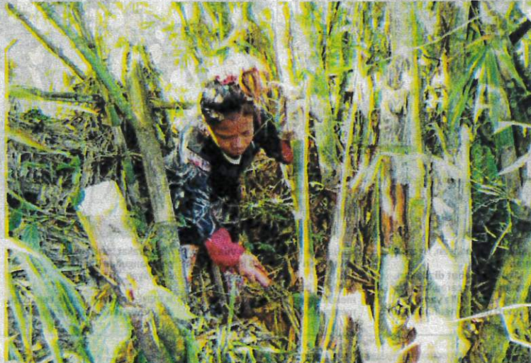
SEORANG wanita Orang Asli etnik Semai menebang buluh untuk dijual di Kampung Simoi Baru, Ulu Jelai di Lipis, Pahang.

Khasmimah berkata, selepas menguruskan makanan keluarga, dia dan rakannya ke hutan pada pukul 7 pagi untuk menebang buluh.