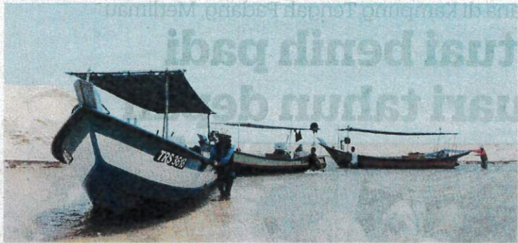
SEBAHAGIAN nelayan terpaksa berpatah balik setelah bot mereka tersangkut pada beting pasir muara Sungai Merchang, Marang semalam.