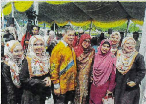
MOHAMAD bergambar dengan orang ramai pada Majlis Rumah Terbuka Aidilfitri Parlimen Kuala Selangor di Bandar Puncak Alam semalam.

KUALA SELANGOR – "Jika ada (lebih), lebih baik untuk kita segera bersedekah," kata Menteri Pertanian dan Keterjaminan Makanan, Datuk Seri Mohamad Sabu.