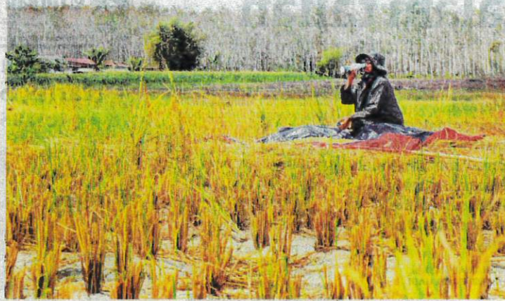
PESAWAH kecewa dengan tindakan membuang beras dan beberapa makanan asas lain di satu lokasi di Temerloh yang tular di media sosial baru-baru ini.

Katanya, bayangkan bagaimana perasaan pesawah dan rakyat apabila melihat beras