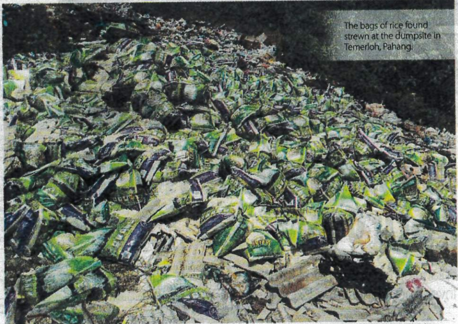
The bags of rice found strewn at the dumpsite in Temerloh, Pahang.

been given to nearby chicken and duck breeders.