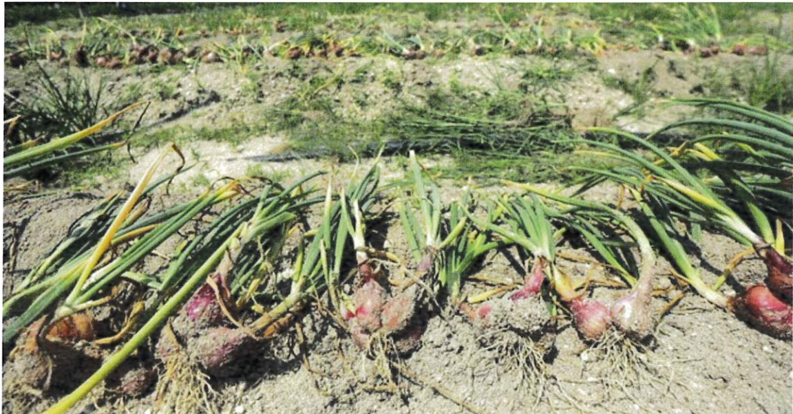
Bawang Perak Dipasarkan Ke Seluruh Negara Esok - MB

GOPENG, 9 Mei (Bernama) -- Lebih 3.3 tan metrik bawang merah kecil BAW-1 yang bakal dijenamakan sebagai Bawang Perak akan dipasarkan ke seluruh outlet Lembaga Pemasaran Pertanian Persekutuan (FAMA), esok.