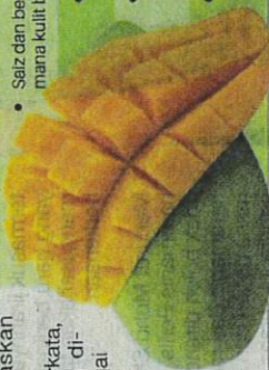
Harumanis Kedah boleh otai Perlis