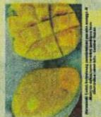
Laporan Sinar Harlan pada 6 Mei lalu.