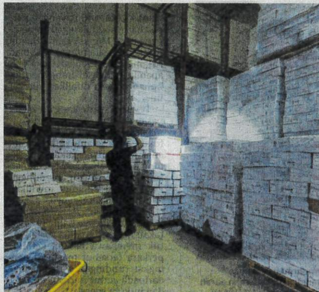
SEBUAH gudang menyimpan ribuan produk sejuk beku seludup di Taman Usahawan Kepong, Kuala Lumpur.

Secara keseluruhan, jumlah anggaran nilai rampasan adalah sebanyak RM546,991.50, manakala nilai sebenar diang-