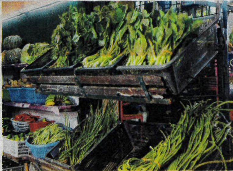
PIHAK berkuasa perlu memastikan sayur yang dijual di pasaran selamat dimakan oleh pengguna.

Tambahnya, walaupun Kementerian Kesihatan tidak