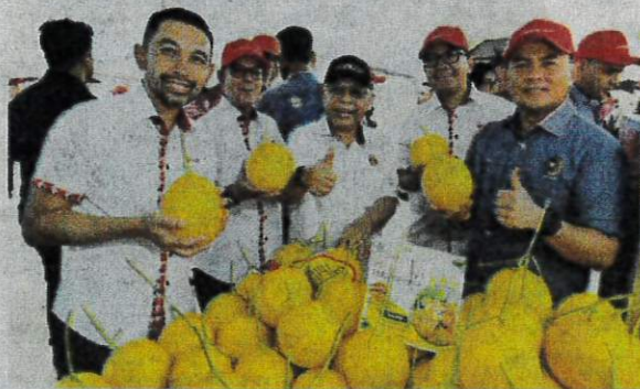
NOVAN (kiri) pada majlis pelancaran kohort baharu Program iTEKAD CIMB Islamic Melon Manis Terengganu Graduate Agropreneur di Terengganu, baru-baru ini.

Kesemua peserta kohort pertama kekal aktif dan mencatatkan pendapatan purata kira-kira RM3,000 seorang bagi setiap musim tuaian, membuktikan keusahawanan agro sebagai laluan kerjaya mampan untuk belia.