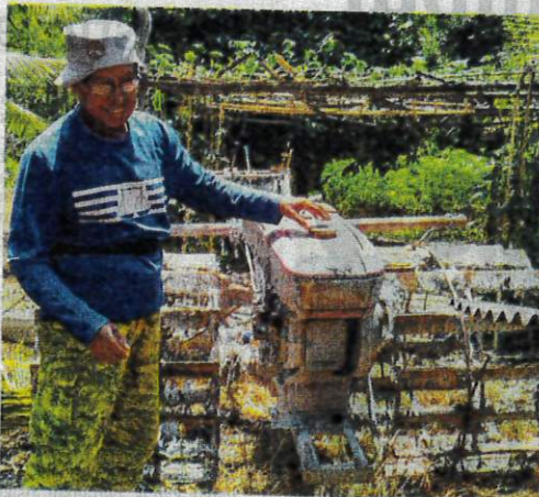
PESAWAH mengakui kenaikan diesel memberi tekanan untuk memulakan tanaman padi musim baharu di Tumpat, Kelantan.

lebih RM6, sekali gus menjadikan kos jentera bagi setiap relung padi meningkat daripada RM180 kepada RM450.