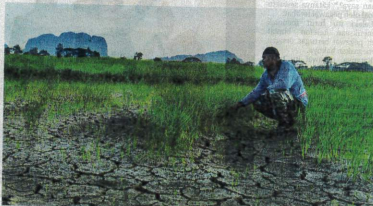
SEORANG petani melihat bendangnya yang kering akibat musim panas ketika ini walaupun musim penanaman dijadual bermula minggu depan.

Beliau berkata, sebelum ini harga diesel sekitar RM3.92 seliter namun kini meningkat kepada