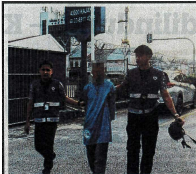
TERTUDUH ketika ditangkap sehari selepas kejadian tular mencampak seekor kucing.