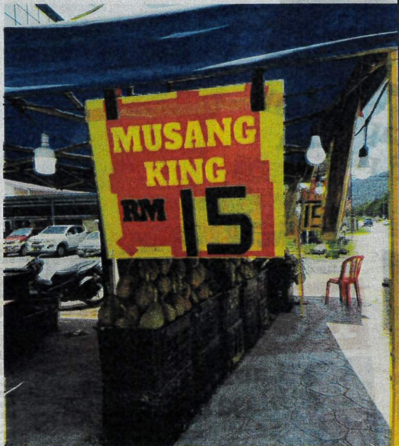
DURIAN musang king yang dijual dengan harga serendah RM15 sekilogram di Bentong.

“Setakat ini kualiti buah adalah baik dan sambutan peminat durian pada permulaan musim ini adalah baik,”katanya di sini hari ini.