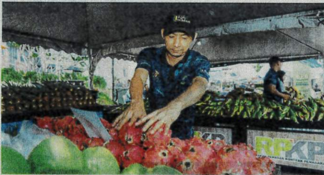
By curbing the influence of middlemen, Fama's market intervention ensures that more profit goes to the producers and more savings go to the rakyat.