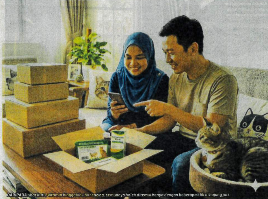
DARIPADA ubat kutu, vitamin hinggalah ubat cacing, semuanya boleh ditemui hanya dengan beberapa klik di hujung jari

Selain itu, bacalah keterangan produk dengan teliti kerana maklumat seperti bahan aktif, fungsi ubat, cara penggunaan serta had umur kucing