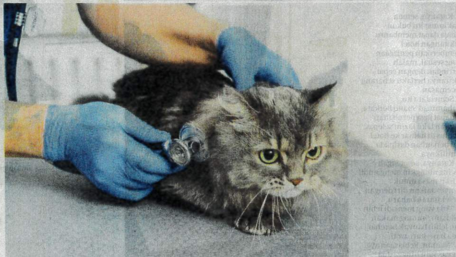
JIKA haiwan peliharaan menunjukkan simptom luar biasa seperti muntah, cirit-birit atau hilang selera makan, dapatkan nasihat doktor haiwan terlebih dahulu.

Pengguna perlu berhati-hati supaya ubat yang dibeli secara dalam talian benar-benar selamat dan sesuai untuk haiwan peliharaan