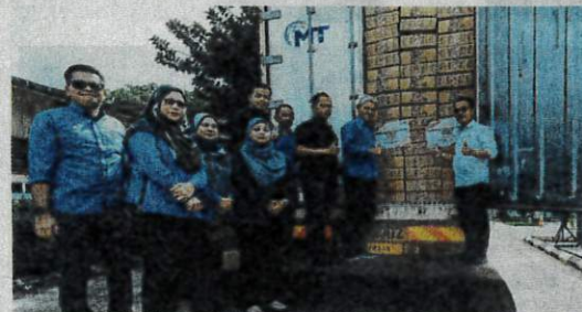
Fama's new 3PL and cold chain project aims to slash delivery expenses for rural farmers by up to 20% by optimising backhaul journeys and eliminating logistical inefficiencies.

Fama is on a mission to curb middlemen and digitalise the farm-to-fork chain to slash Malaysian grocery bills