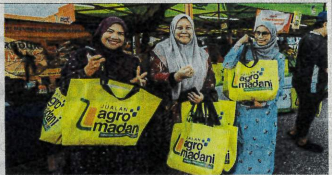
Shoppers will enjoy a guaranteed supply of fresh produce at controlled prices through Fama's nationwide rejuvenation of market outlets.

By LEE CHONGHUI chonghui.lee@thestar.com.my