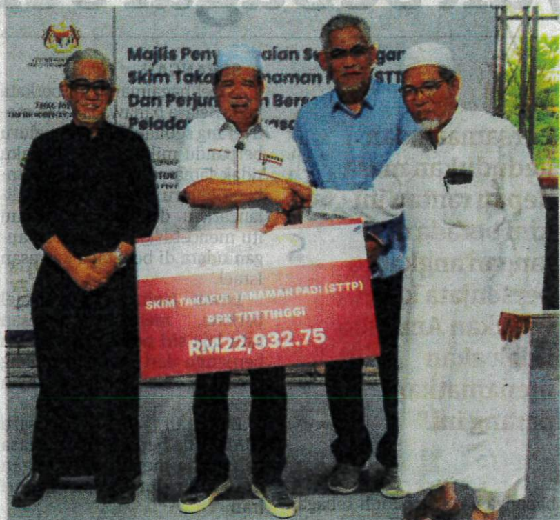
MENTERI Pertanian dan Keterjaminan Makanan, Datuk Seri Mohamad Sabu (dua kiri) menyampaikan Skim Takaful Penanaman Padi kepada penerima di Kedah, baru-baru ini.

“Skim ini bukan sahaja memberi perlindungan kewangan, malah membantu meningkatkan daya tahan pesawah dalam menghadapi risiko yang boleh menjejaskan sumber pendapatan mereka,” katanya dalam kenyataan.