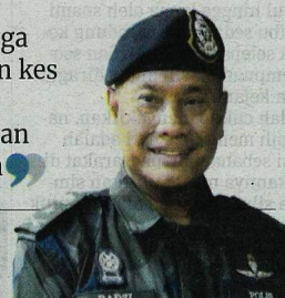
Ahmad Radzi Hussain, Komander Briged Tenggara

“Sepanjang Januari hingga Mei, kita merekodkan lapan kes berkaitan rampasan lembu memabitkan nilai rampasan keseluruhan lebih RM1 juta”