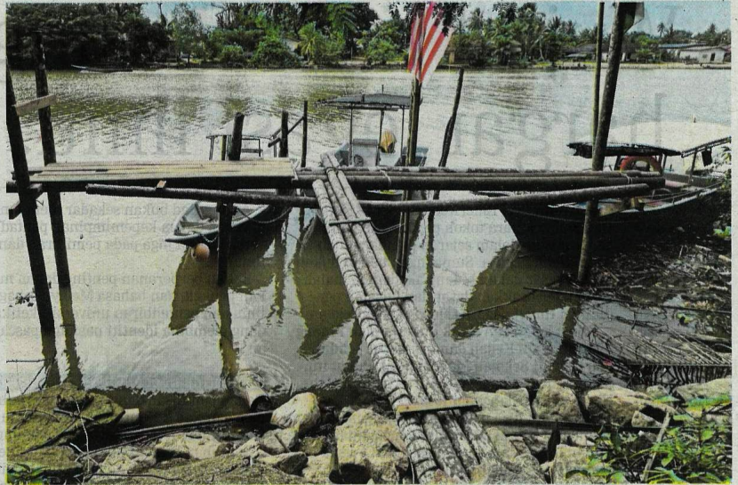
Pangkalan haram sepanjang Sungai Golok di Tumpat dikenal pasti antara laluan untuk kegiatan penyeludupan lembu korban dari Thailand menjelang Aidiladha.

6 pangkalan haram jadi laluan penyeludupan dari Thailand menjelang Aidiladha