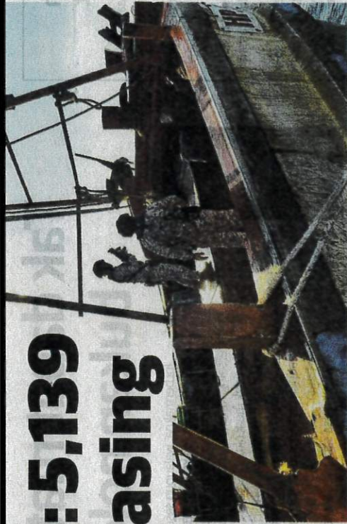
Anggota Maritim Malaysia melakukan pemeriksaan terhadap kapal nelayan asing selepas didapati menceroboh perairan negara ketika Op Naga.