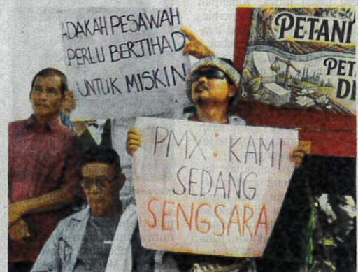
Antara plakat yang dipamerkan ketika himpunan berlangsung.

Pada himpunan itu, selain kerajaan dituntut agar menaikkan harga lantai padi bermuarah ke RM3,000