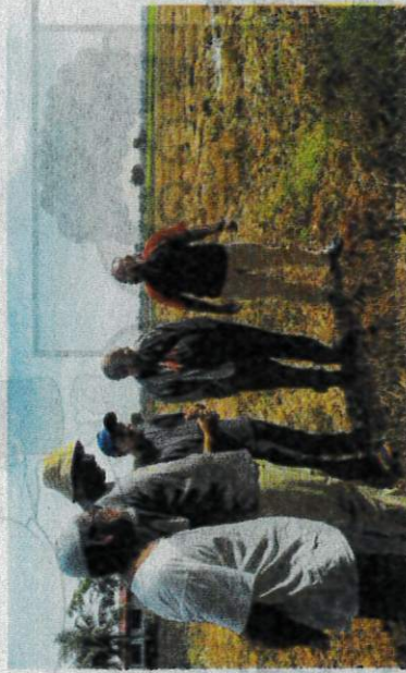
PESAWAH menggesa kerajaan kaji semula mekanisme bantuan termasuk pelaksanaan kad fleet untuk kawal kos jentera.

"Ketika ini terdapat kira-kira 240,000 pesawah berbanding hanya sekitar 20,000 jentera. Jadi kebergantungan kepada jentera sangat tinggi dan harga yang tidak menentu memberi tekanan kepada kami. Dengan