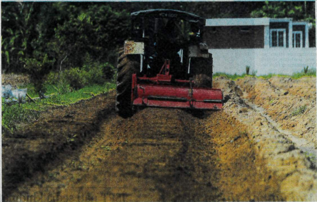
PESAWAH membajak menggunakan jentera di Kampung Tanah Merah, Jitra.

"Air kita ada sedikit di sawah. Jadi, guna apa yang ada di sawah walaupun sedikit, untuk mula mengusahakan tanaman. Jika berlaku masalah seperti tanaman tidak menjadi, laporan kepada Pertubuhan Peladang