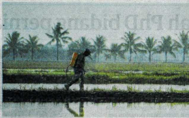
SEORANG pesawah meninjau kawasan sawah padi yang mula digenangi air selepas hujan lebat sejak kebelakangan ini di Kampung Jejawi, Arau, Perlis, semalam.